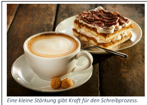
Eine kleine Stärkung gibt Kraft für den Schreibprozess.

Darüber hinaus bietet das Unperfekthaus allen Gästen eine reichhaltige Auswahl kalter und warmer alkoholfreier Getränke. Während der Seminarzeit können nach Herzenslust Kaffee, Chocochino, diverse Teesorten, aber auch Softdrinks, Eistee und Fruchtsaftgetränke genossen werden.